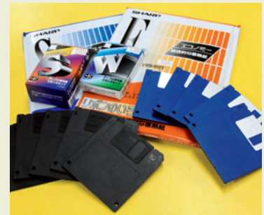
インクリボンや感熱紙、FDも販売されている