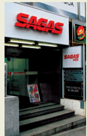
地下1階のフロアでワープロ販売