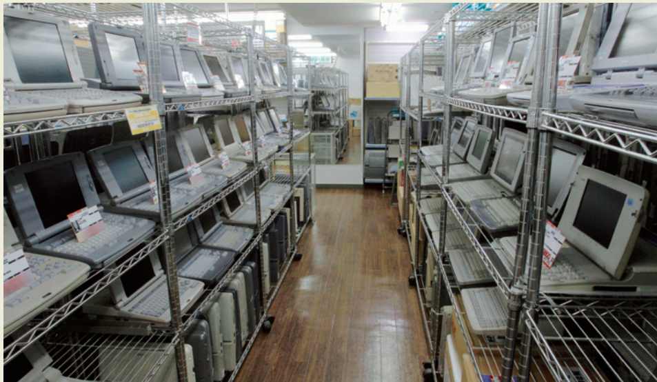
壮観！ズラリと並ぶ中古ワープロ。いまだ需要は途切れることがない