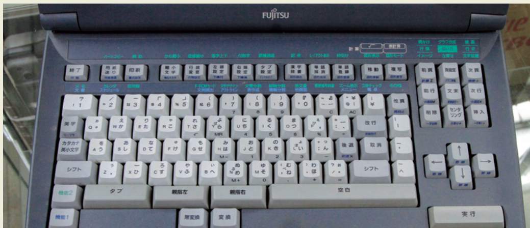
懐かしや、PC時代に消えた「親指シフト」機も。ワープロ検定では常に「親指シフト」が上位だった